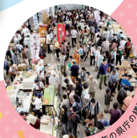
去年の県庁の様子