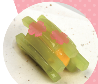
いばらきスイーツコンテスト2018 和菓子部門 クランプリ 五條製菓 (水戸)