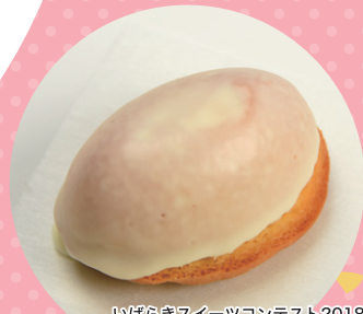
いばらきスイーツコンテスト2018 焼菓子部門 クランプリ 日立和洋菓子 いちかわ (日立)