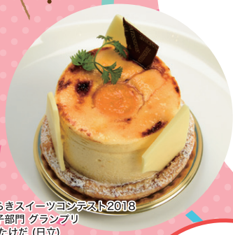
いばらきスイーツコンテスト2018 洋菓子部門 クランプリ 菓匠 たけだ (日立)