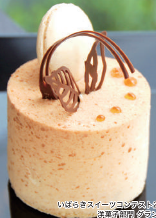
いばらきスイーツコンテスト2015 洋菓子部門 グランプリ パティスリーシュール ミカワ (水戸)