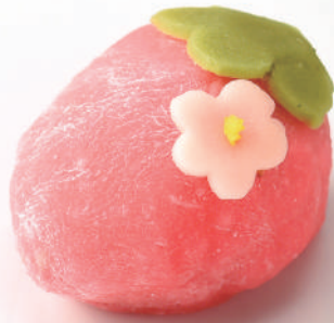
いばらきスイーツコンテスト2019 和菓子部門 グランプリ 菓匠にいつま (水戸)