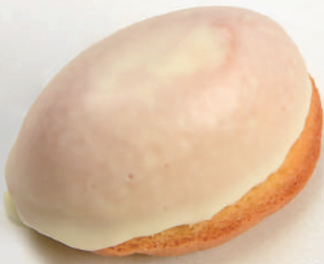
いばらきスイーツコンテスト2018 焼菓子部門 グランプリ 日立和洋菓子 いちかわ (日立)